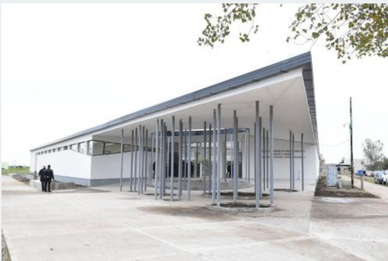
Inauguración del nuevo edificio: 31 de marzo de 2019